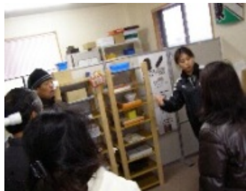
メンバーによって作業の仕方も変わると話す指導員さん