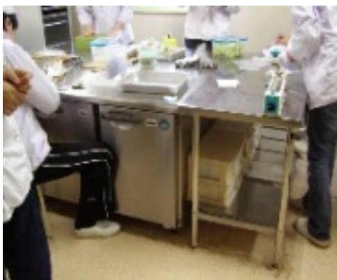
ワークショップ くすのき 作業風景

地を探し続けて北海道から九州まで全国各地を転々とした事にはとても驚いたし、子供たちの事を思う気持ちの強さに衝撃を覚えました。また、近隣の住民の人達に障害児者の事を理解してもらおうために、区長さん達と何度も話し合いを設けて一年の交渉を経てやっと理解してもらったことが出来たからこそ、年に一度の苑まつりの時に、三百人以上の人達がくすのき苑を訪れてくれて、利用者の作った作品や製品を快く買って行って下さるのだろうし、また、小学校から交流を求められて、毎年三年生が社会科の授業の一環として見学に訪れるという事にも繋がっているのだと思う。見学参加者の質問にも丁寧に答えて頂き、また施設内を案内しながら下さる説明は