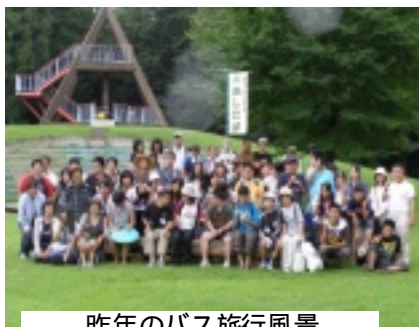
昨年のバス旅行風景

今年も次の通りバス旅行 を実施します。詳細は、7 月号の会報でお知らせしま す。