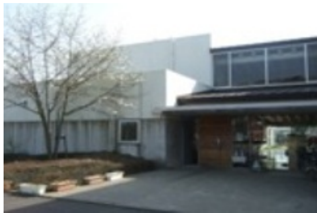
入所厚生施設 くすのき苑

2月10日(水)、初めて小型バスを貸し切ったの施設見学に行ってきました。午前中に千葉県野田市にある社会福祉法人いちいの会が運営する「くすのき苑」と「ワー