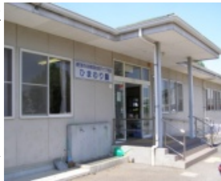
駅から徒歩10分弱。 小学校の隣にあります

件がある中で苦慮されているのだとは思いますが、まだまだ出来ること、やらなければいけないことがあるはず！との思いから、失礼ながら質問より意見を出させて頂きました。デイケア施設とはなんのための施設であり、指導員は利用者のために何をすべきかを考えて、社会生活や、作業の指導を行ってほしいです。そして、いつの日か、ひまわり園の職員の方が胸を